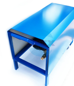
Mascara grup pompare Tabla colorata, rezistent la coroziune ( optional )