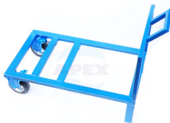
Suport mobil Roti de cauciuc ( optional )