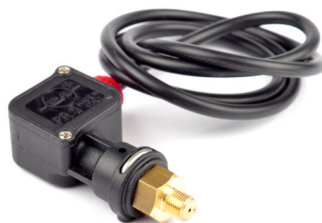
Presostat PS6 Presiune operare: 250 bar Temperatura maxima: 90 C