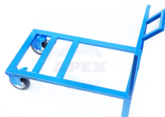
Suport mobil Roti de cauciuc