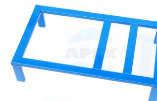
Cadru fix grup pompare Inaltime 15 cm ( optional )