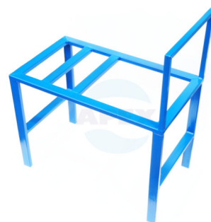
Cadru fix grup pompare Inaltime 60 cm ( optional )