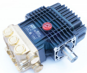
Pompa UDOR PKC 13/17 170 bar, 13 L/min